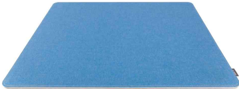
Sous-main Eyestyle, bleu clair / gris foncé