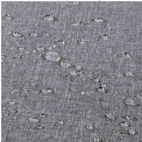
Visuel de référence : présente la finition hydrofuge avec effet perlant