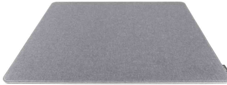
Sous-main Eyestyle, gris clair / noir