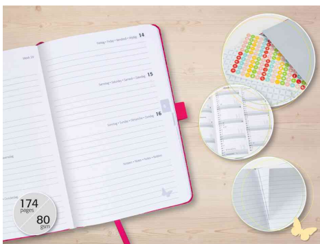
Visuel de référence: montre l'intérieur