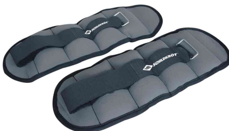
Haltères souples poignet-cheville, 1,0 kg