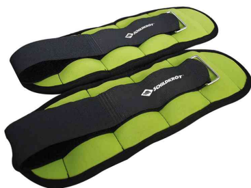
Haltères souples poignet-cheville, 0,5 kg

- accessoires d'entraînement idéal pour l'aérobic, la gymnastique, le jogging, la marche ou d'autres sports d'endurance