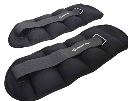
Haltères souples poignet-cheville, 2,0 kg