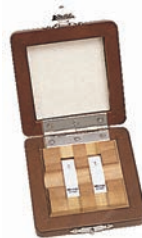
2 db-os kerámia hasábkészlet

A gyári bizonyítvány a mérőhasábokat sorozatszámmal és azonosító számmal együtt tartalmazza. Minden egyes mérőhasáb névleges mérettől való eltérése a mérés időpillanatában értendő. A mérőhasábok mérése mérőhasáb komparátorral történik. K-osztályú hasábok interferométerrel kerülnek bemérésre.