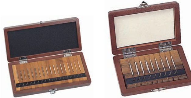
18 db-os kerámia hasábkészlet