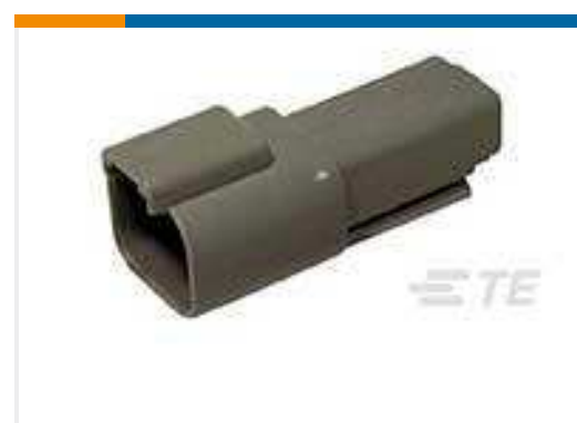
TE Teilnr.:DT04-2P REC, 2P, GRY, N