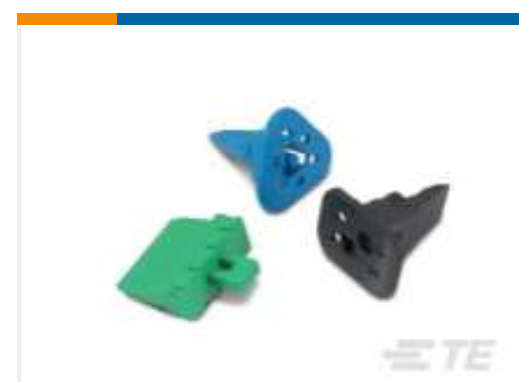
TE Teilnr.:W2S DEUTSCH DT Keilschlösser