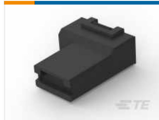
TE Teilnr.: 2133857-3 250 FASTON HSG.,FLAG,REC.,1 POS, BLACK