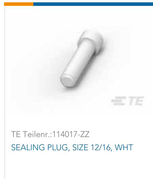
TE Teilnr.:114017-ZZ SEALING PLUG, SIZE 12/16, WHT