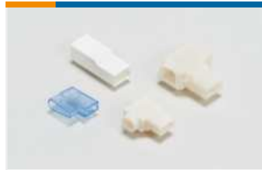
Gehäuse für Crimpkontakte(41)