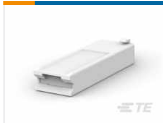
TE Teilnr.: 969518-2 250 FASTON HSG. REC. 1P NATURAL