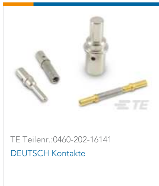
TE Teilnr.:0460-202-16141 DEUTSCH Kontakte