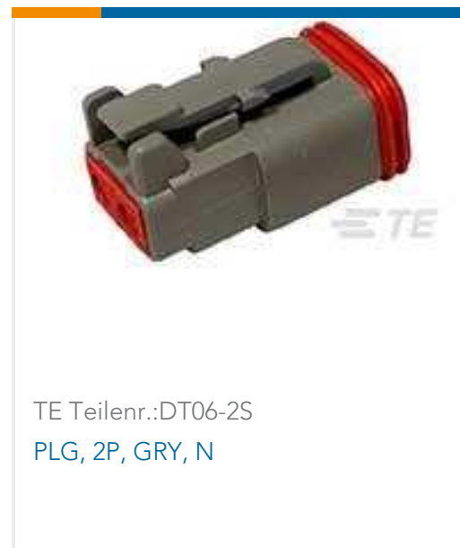
TE Teilnr.:DT06-2S PLG, 2P, GRY, N