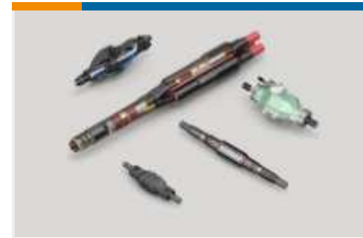
Muffen und Kabelverbinder(1)