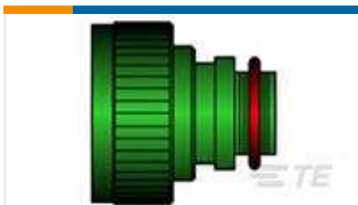
TE Teilnr.:506793-000 TXR54AB00-1005AI