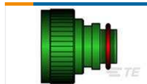
TE Teilnr.:296535-000 TXR41AB00-1605AI