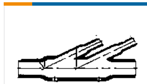
TE Teilnr.:820168-000 462A214-25-0