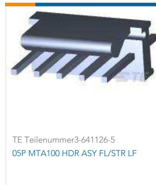
TE Teilenummer3-641126-5 05P MTA100 HDR ASY FL/STR LF