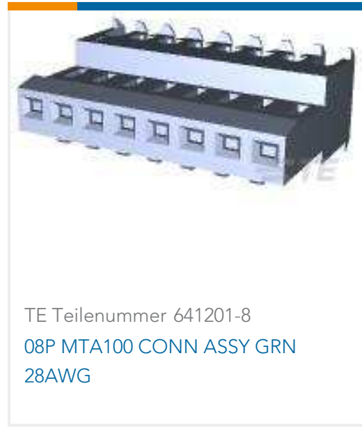
TE Teilenummer 641201-8 08P MTA100 CONN ASSY GRN 28AWG