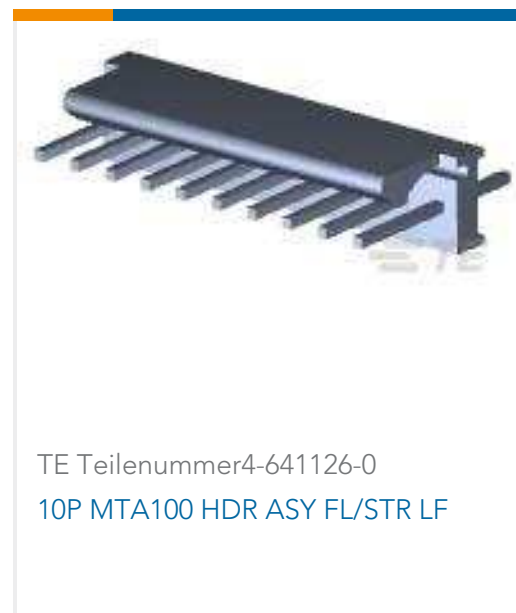
TE Teilenummer4-641126-0 10P MTA100 HDR ASY FL/STR LF