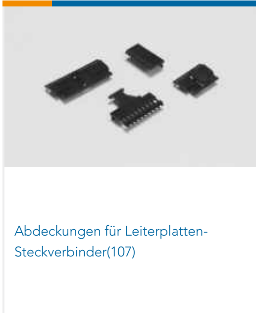
Abdeckungen für Leiterplatten-Steckverbinder(107)