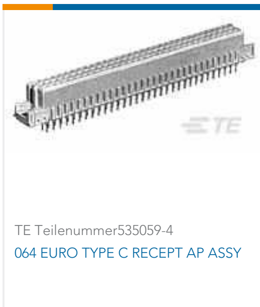
TE Teilenummer535059-4 064 EURO TYPE C RECEPT AP ASSY