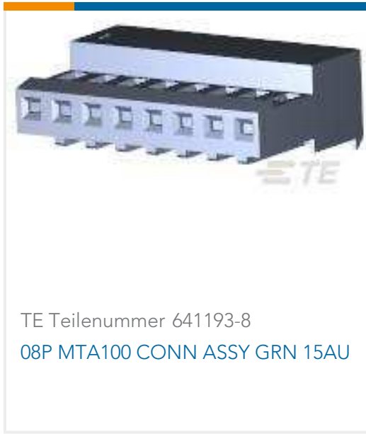
TE Teilenummer 641193-8 08P MTA100 CONN ASSY GRN 15AU