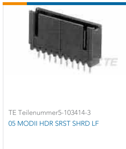
TE Teilenummer5-103414-3 05 MODII HDR SRST SHRD LF