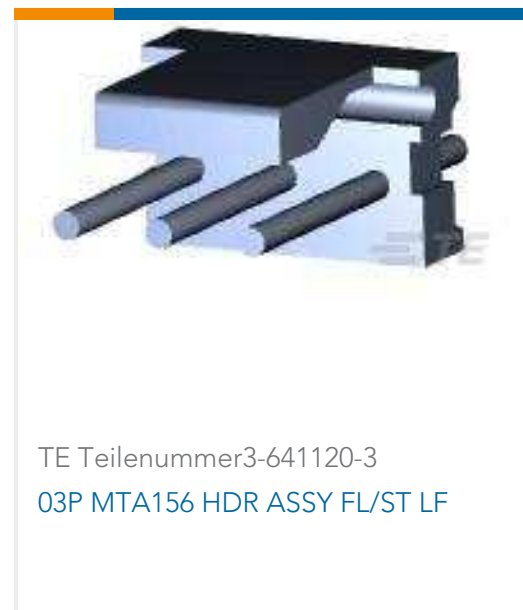
TE Teilenummer3-641120-3 03P MTA156 HDR ASSY FL/ST LF