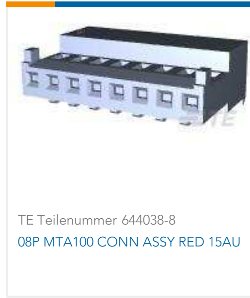
TE Teilenummer 644038-8 08P MTA100 CONN ASSY RED 15AU