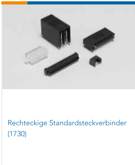
Rechteckige Standardsteckverbinder (1730)