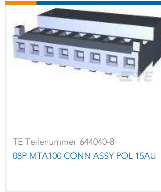
TE Teilenummer 644040-8 08P MTA100 CONN ASSY POL 15AU