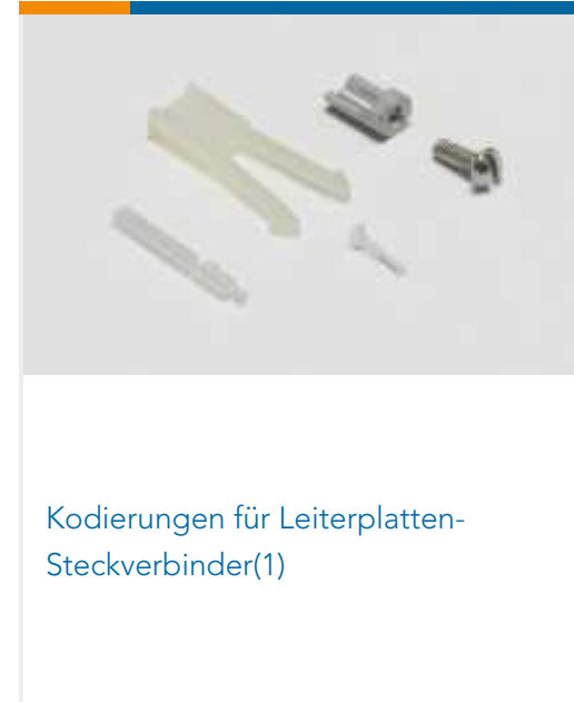
Kodierungen für Leiterplatten-Steckverbinder(1)