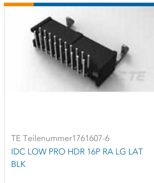
TE Teilenummer1761607-6 IDC LOW PRO HDR 16P RA LG LAT BLK