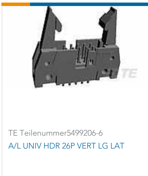
TE Teilenummer5499206-6 A/L UNIV HDR 26P VERT LG LAT