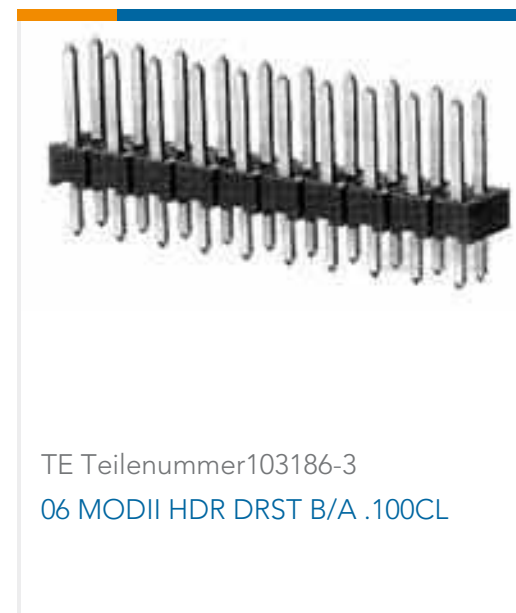
TE Teilenummer103186-3 06 MODII HDR DRST B/A .100CL