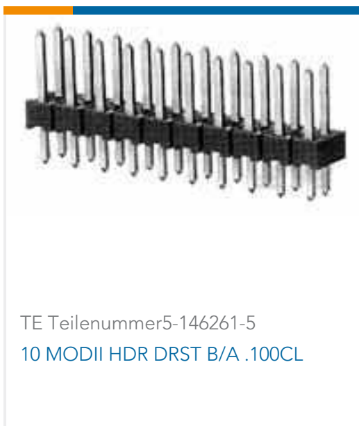
TE Teilenummer5-146261-5 10 MODII HDR DRST B/A .100CL