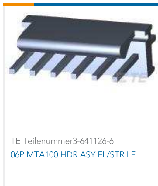
TE Teilenummer3-641126-6 06P MTA100 HDR ASY FL/STR LF