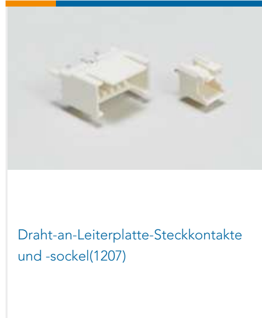
Draht-an-Leiterplatte-Steckkontakte und -sockel(1207)