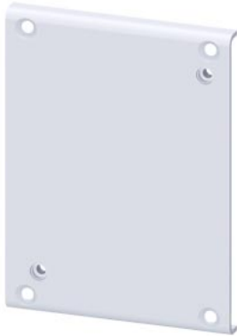
Adapterplatte zum Austausch von Schützen 3TF52 / 3TK52 auf SIRIUS 3RT1.5