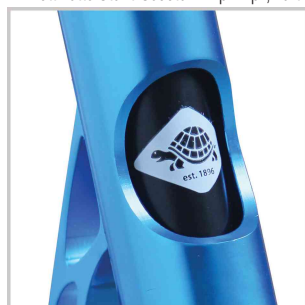
Détail: Découpe CNC