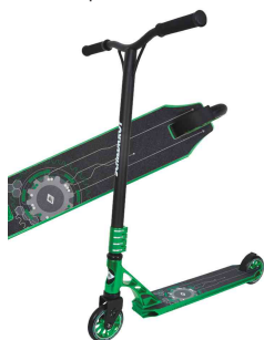
Trottinette Stunt-Scooter "Flipwhip", vert