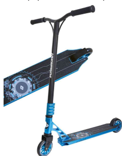
Trottinette Stunt-Scooter "Flipwhip", bleu

- offre un équipement technique sensationnel pour ceux qui aiment les acrobaties dans les skateparks et le street-riding