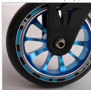
Détail : Roue