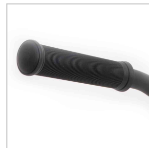
Détail : Poignées en TPR