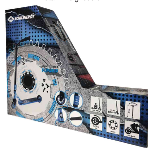
Visuel de référence : Emballage