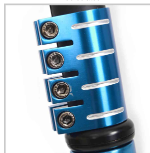
Détail: Serrage à 4 positions