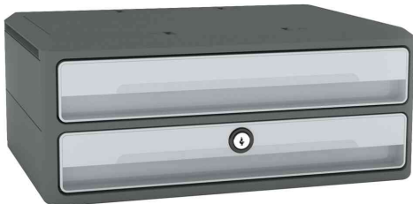
Schubladenbox MoovUp Secure, 2 Schübe, grau