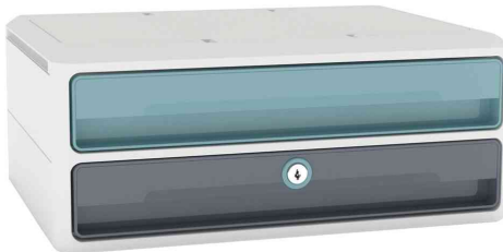
Schubladenbox MoovUp Secure, 2 Schübe, minz