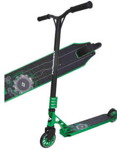
Tretroller Stunt-Scooter "Flipwhip", grün