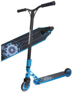
Tretroller Stunt-Scooter "Flipwhip", blau

- bietet technisch eine sensationelle Ausstattung für die Stuntspezialisten im Skatepark und beim Street-Riding