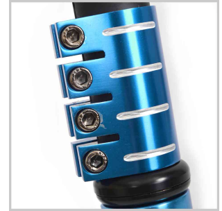
Detail: 4-fach Klemme