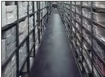
Universelle Anti-Rutsch-Läufer als Bodenbelag