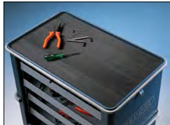
Universelle Anti-Rutsch-Läufer als Werkzeugunterlage