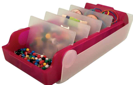
Visuel de référence: montre le produit en utilisation