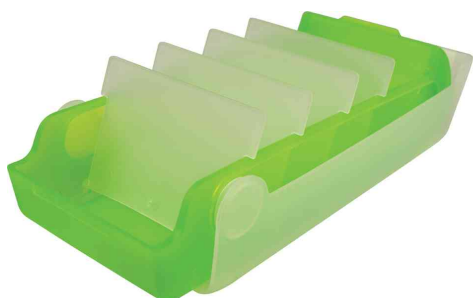
Boîte à fiches éducatives "the beebox", citron vert translucide