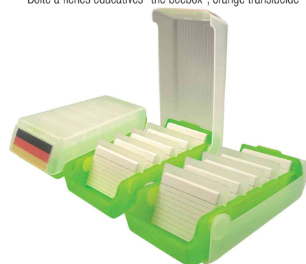
Visuel de référence: montre le produit en utilisation