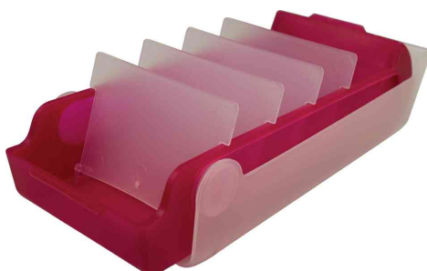
Boîte à fiches éducatives "the beebox", framboise translucide