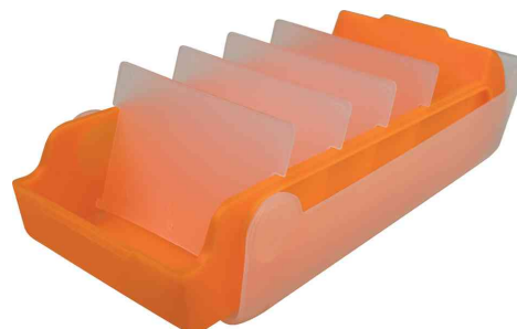
Boîte à fiches éducatives "the beebox", orange translucide