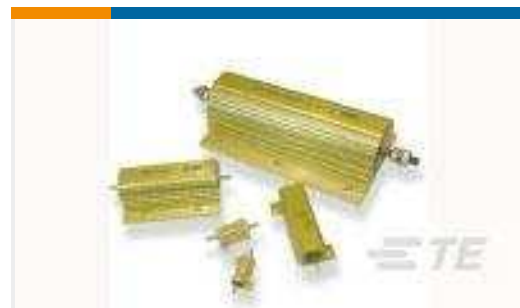
TE Teilnr.:1-1630019-4 HSC200 2K4 5%