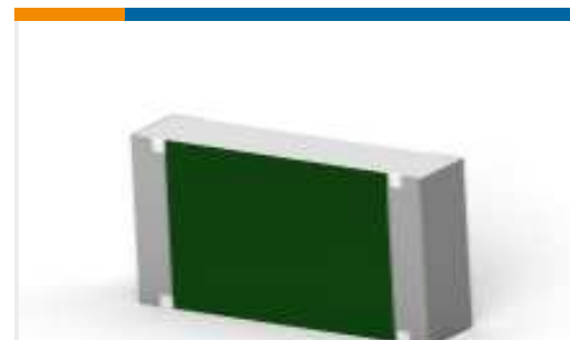
TE Teilnr.:9-2176397-4 3502 7K5 1%