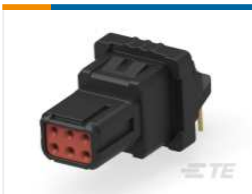
TE Teilnr.:YD369-B99-AP400000 Rectangular Connectors: 9-Way Panel Mount, 90PCB