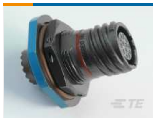
TE Teilnr.:YDTS24T15-18PNV001 RECP ASSY