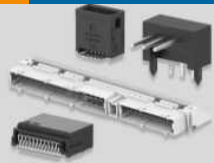
Leiterplattenstiftleisten und -buchsen (283)