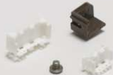
Montage von Leiterplatten- Steckverbindern(8)