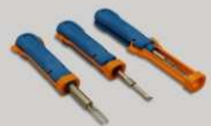
Einsetz- und Entriegelungswerkzeuge (1)