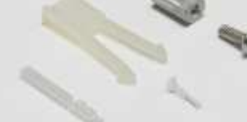
Kodierungen für Leiterplatten- Steckverbinder(1)