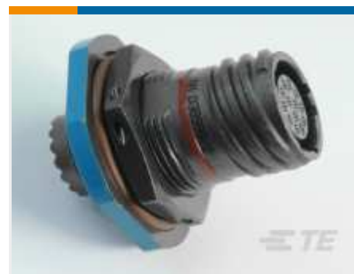
TE Teilnr.:YDTS24T21-35SNV001 RECP ASSY