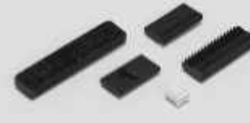
Kabel-an-Leiterplatte- Steckverbindersätze und -gehäuse(152)