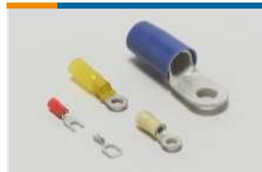
Ringe und Gabelkontakte(208)