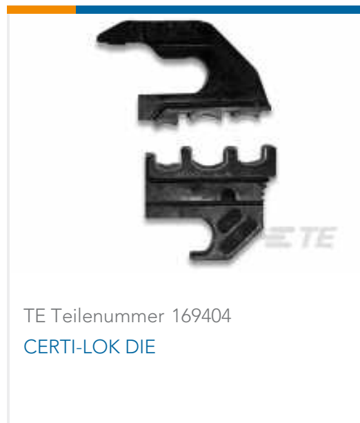
TE Teilenummer 169404 CERTI-LOK DIE