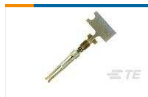
TE Teilenummer66505-4 HD 20 DF SOCKET PLTD