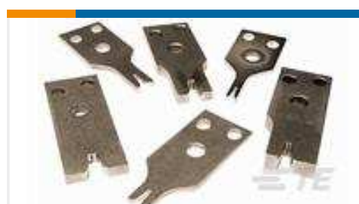
TE Teilenummer5-456135-7 CRIMPER, INSULATION "O"(.062")