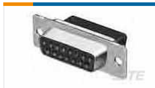
TE Teilenummer1658644-1 HDP-20,RCPT,SIZE 2, 15 POSN,CL