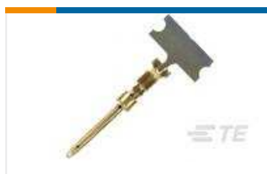
TE Teilenummer1658539-3 PIN CONT DUPL PLT LP HD-20 AMP