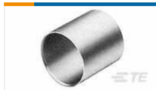
TE Teilenummer3-747579-6 SHLDNG FERRULE, PLTD, BULK PKG