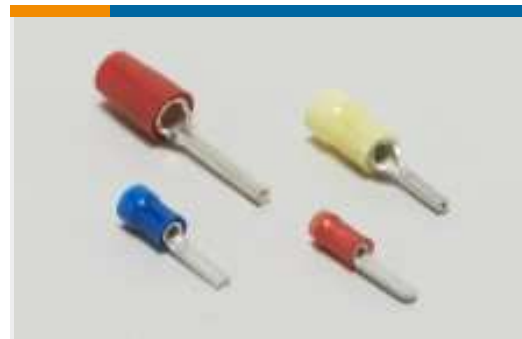
Crimp-Aderend-Hülsen, Flachkontakte und Ferrulen(11)