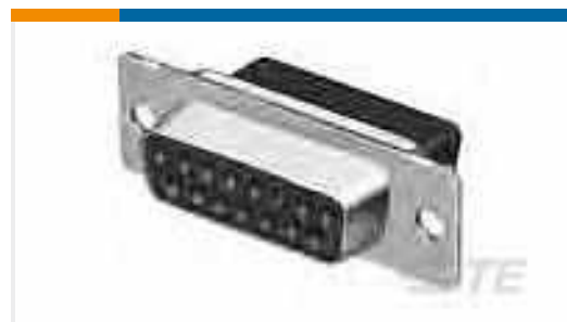
TE Teilenummer207516-5 HDP-20,RCPT,SIZE 3, 25 POSN,CL