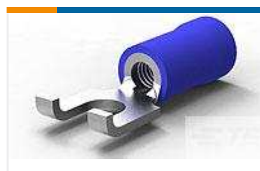
TE Teilenummer324165 TERMINAL,PG SPD FLG 16-14 6