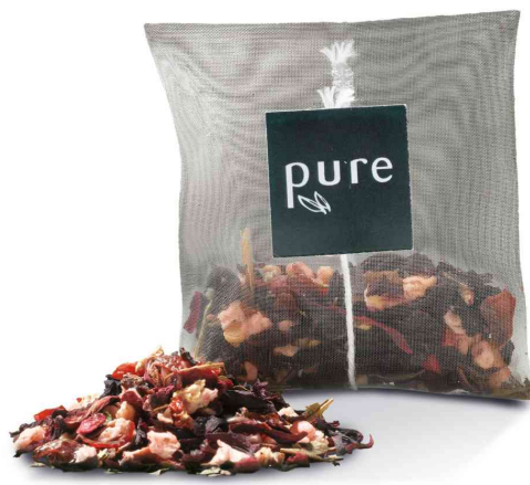
Visuel de référence: sachet en nylon