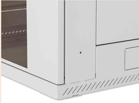
Detailansicht: breitere Schrankecken