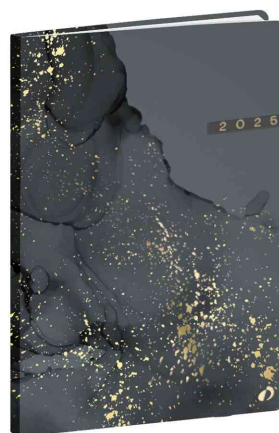
Agenda "Ministre" HIPSY, noir