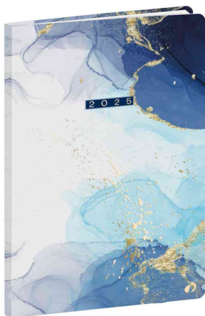
Agenda "Ministre" HIPSY, bleu