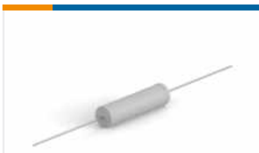
TE Teilnr.:4-2176414-8 7W STD M/OX 5% 1K8