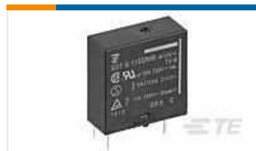
TE Teilnr.:8-1419125-5 SDT-S-106LMR,000