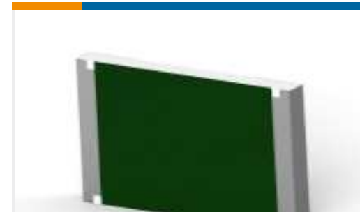
TE Teilnr.:8-2176407-8 3560 27R 5%