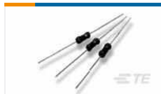
TE Teilnr.:4-1879350-2 RR01 5% 11R AMMO