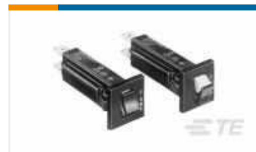
TE Teilnr.:1-1393250-7 W28-XQAT-15=W28