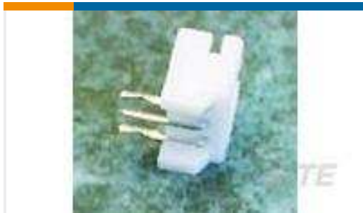
TE Teilnr.:1-440055-1 2.0MM,HDR,11POS,R/A