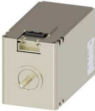
Unterspannungsauslöser UVR 110...120 V AC/DC Zubehör für Leistungsschalter 3WL10 / 3VA27