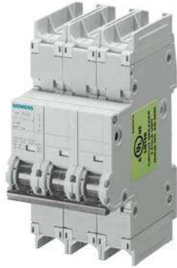
Leitungsschutzschalter 240V 10kA, 3-polig, D, 50A, T=70mm nach UL 489