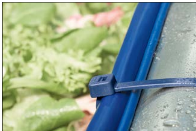
Unsere MCT(S) Kabelbinder zum Einsatz in der Lebensmittel- und Pharma-Industrie.