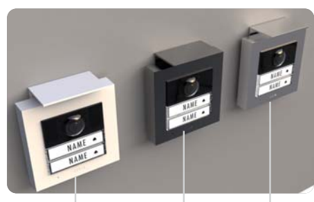
WEISS ANTHRAZIT SILBER

2-Familienhaus Außenstation erhältlich in 3 Farben