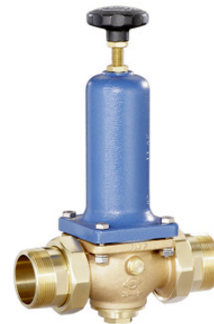
DN 40 - DN 65