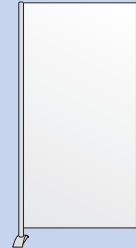
Whiteboard/ Acryl- Element