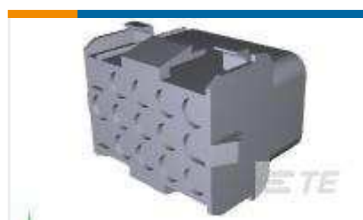
TE Teilnr.:926647-2 15P UN-MNL AUFN-GEH