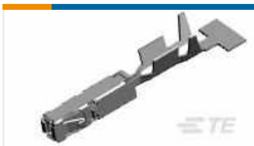
TE Teilnr.:1418410-1 AMP MCP 1.5K, CONTACT