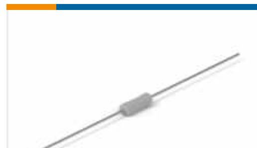
TE Teilnr.:7-1676123-9 1/2W SM M/OX 5% 1K5