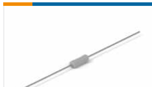
TE Teilnr.:7-1676123-7 1/2W SM M/OX 5% 1K2