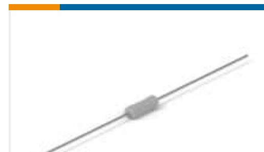
TE Teilnr.:6-1676123-0 1/2W SM M/OX 5% 240R