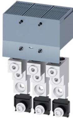
Rundleiteranschlussklemme 2 Kabel 3 Stück Zubehör für: 3VA1 400/630 3VA2 400/630