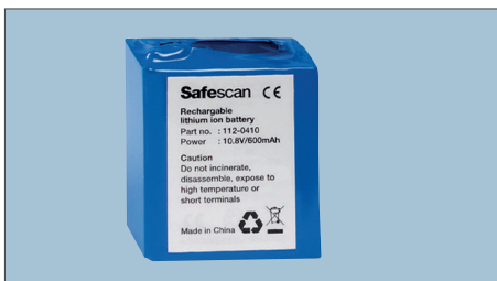
ARBEITET BIS ZU 30 STUNDEN!