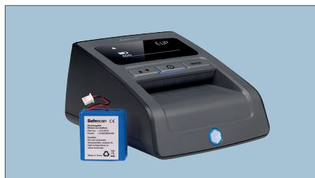
GEEIGNET FÜR SAFESCAN 135i, 155i & 165i