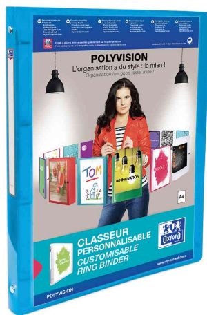
Classeur personnalisable POLYVISION, bleu