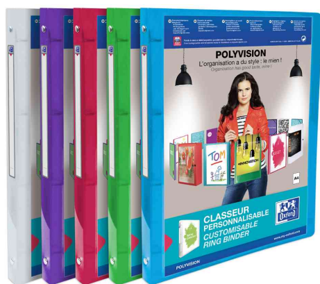
Classeur personnalisable POLYVISION, assorti

- pour une organisation individuelle des offres, présentations et documents