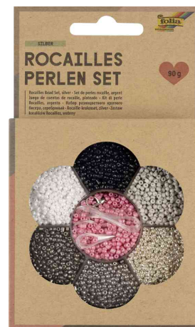
Set de perles de rocaïlle ARGENT