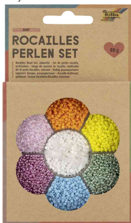
Set de perles de rocaïlle MULTICOLORE