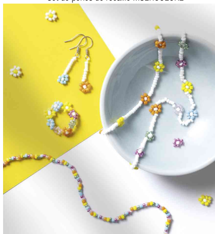
Visuel de référence : présente le produit en utilisation (MULTICOLORE)