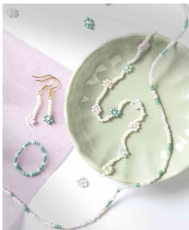
Visuel de référence : présente le produit en utilisation (PASTEL)