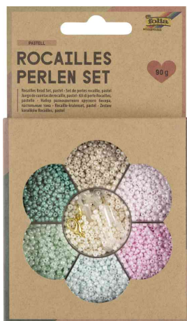
Set de perles de rocaïlle PASTEL