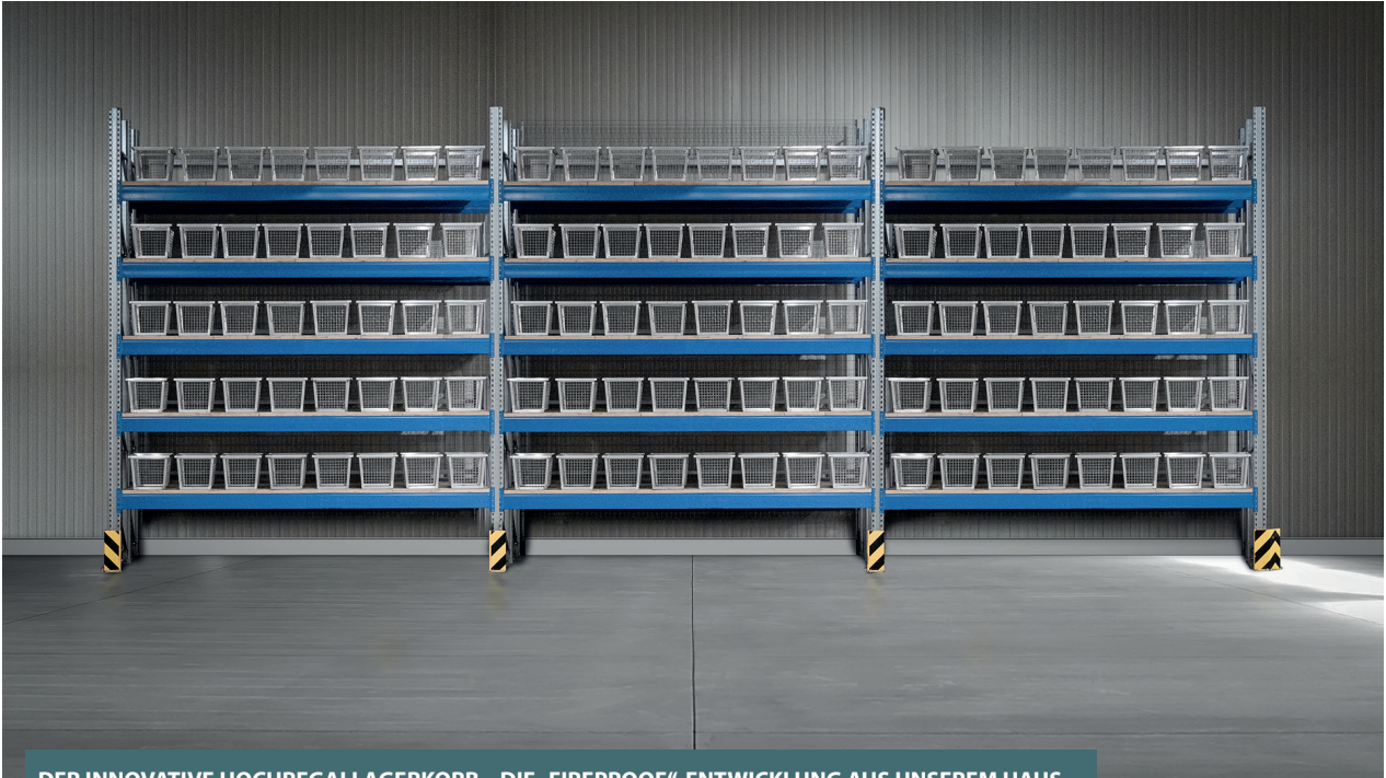
DER INNOVATIVE HOCHREGALLAGERKORB – DIE „FIREPROOF“-ENTWICKLUNG AUS UNSEREM HAUS