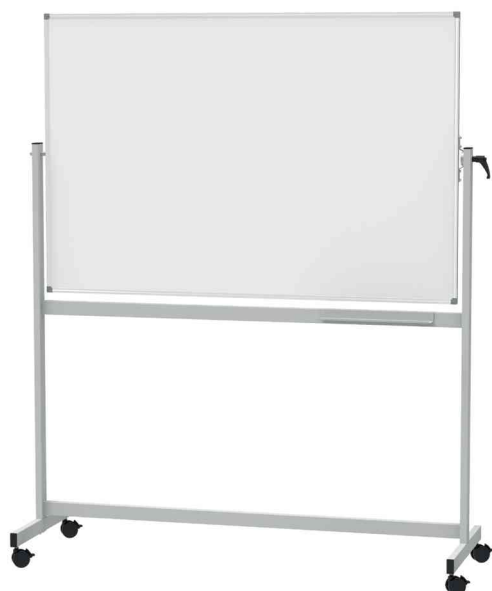
Tableau rotatif MAULstandard

- comme panneau d'information, à la réception, près de la pointeuse, dans les cantines, dans les écoles ou lors de séminaires