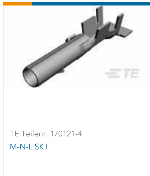
TE Teilnr.:170121-4 M-N-L SKT