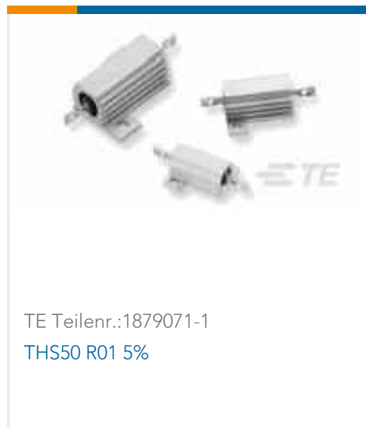
TE Teilnr.:1879071-1 THS50 R01 5%