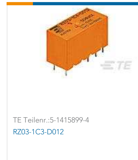
TE Teilnr.:5-1415899-4 RZ03-1C3-D012