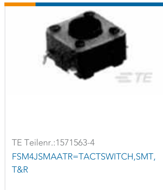
TE Teilnr.:1571563-4 FSM4JSMATR=TACTION SWITCH, SMT, T&R