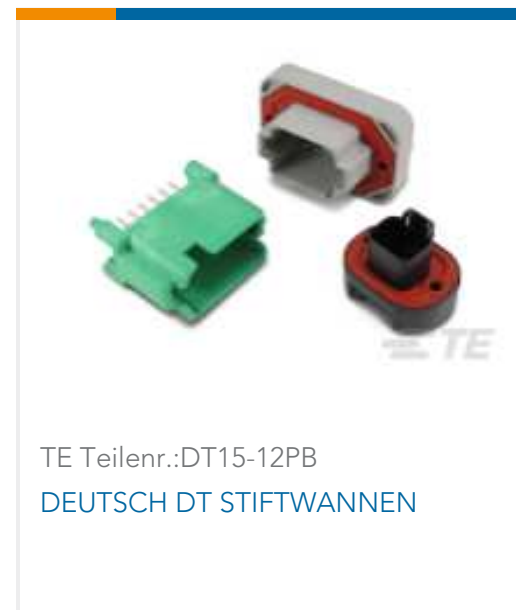
TE Teilnr.:DT15-12PB DEUTSCH DT STIFTWANNEN