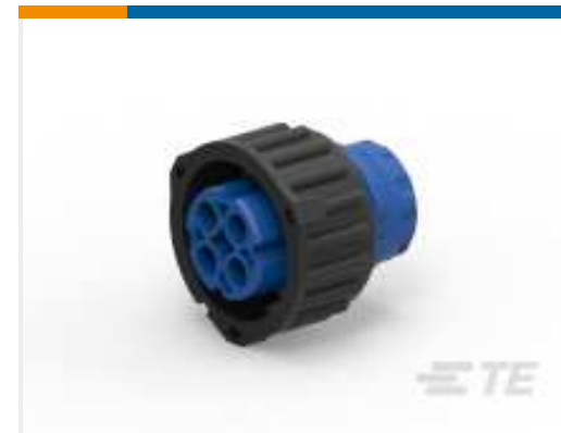
TE Teilenummer 4-967325-1 2,5MM BU-GEH 4P,BL