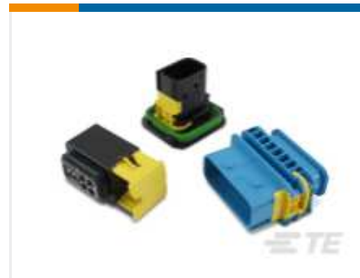
TE Teilenummer CAT-H3399-CH8172 HDSCS GEHÄUSE