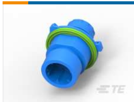
TE Teilenummer CAT-C4962-CH8172 RUNDE DIN-GEHÄUSE