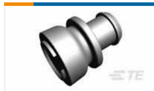
TE Teilenummer828920-1 EINZELADERDICHTUNG