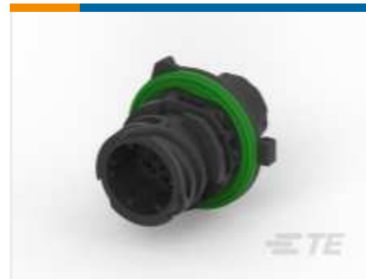
TE Teilenummer 1718230-1 1,5MM PIN HSG 5-7 POS ASSY