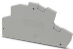
Abbildung zeigt ähnlichen Artikel

Abschlussdeckel, Länge: 78 mm, Breite: 2,2 mm, Farbe: grau