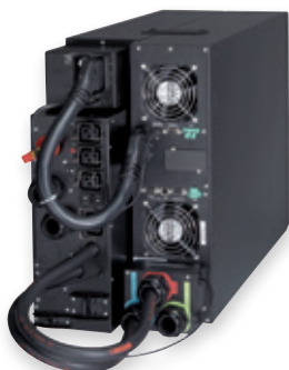
Eaton 9PX 11kVA mit Wartungsbypass

Die 9PX ist eine Energy Star® qualifizierte USV