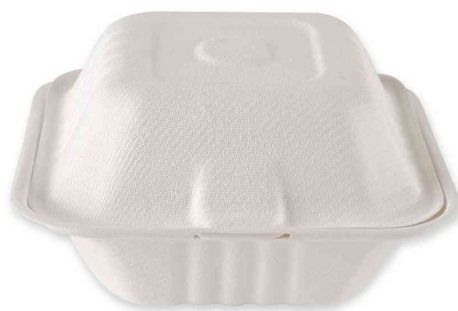
Boîte à burger en canne à sucre