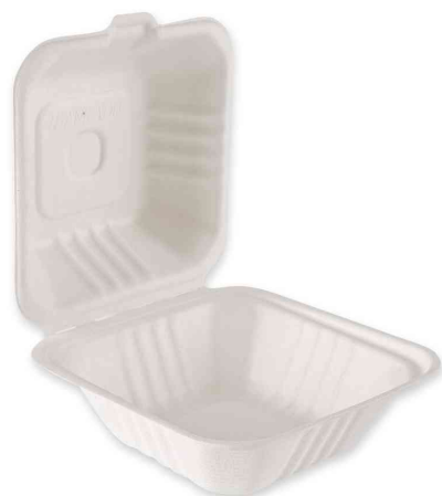
Boîte à burger en canne à sucre