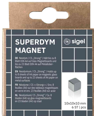
Neodym-Würfelmagnet "Strong" C5, 6er Set