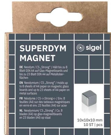
Neodym-Würfelmagnet "Strong" C5, 10er Set