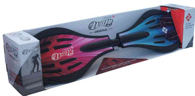
Visuel de référence : Emballage