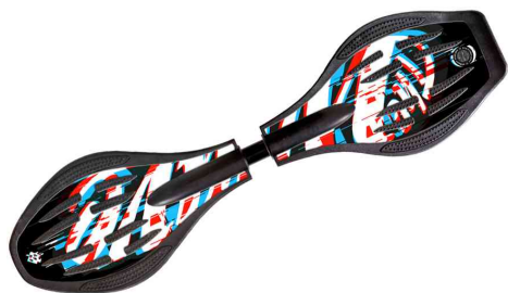
Motif: Black Glitch