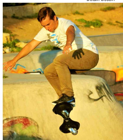
Visuel de référence : présente le produit en utilisation