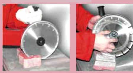
Sicher schneiden, Lösen, Austauschen