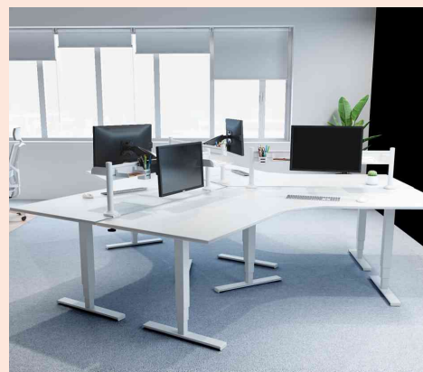
Visuel de référence : présente les produits en utilisation sur les bureaux doubles