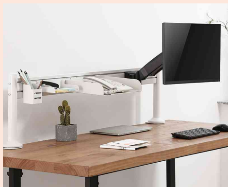
Visuel de référence : présente les produits en utilisation contre le mur