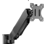
Accessoire : Bras articulé pour moniteur pour rail d'organisation N:\VivalP\Koepte\74056\E00019-5.jpg