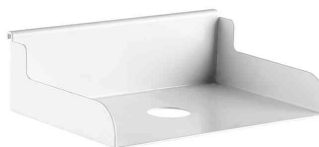
Accessoire : Corbeille de rangement pour rail d'organisation N:\VivalP\Koepte\74056\E00019-7.jpg