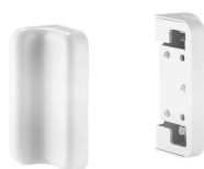
Accessoire : Set de supports muraux pour rail d'organisation, set de 2 N:\VivalP\Koepte\74056\E00019-3.jpg