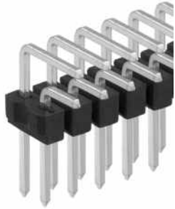
Leiterkartensteckverbinder>Stiftleisten Stiftleiste □ 0,635 mm, "Maße A + B" variabel