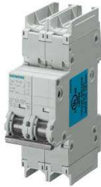
Leitungsschutzschalter 240V 14kA, 2-polig, C, 20A, T=70mm nach UL 489