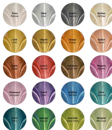
Aperçu des couleurs