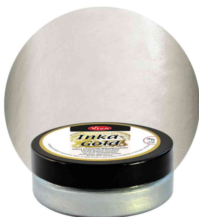
Visuel de référence : Inka-Gold, 62,5 g