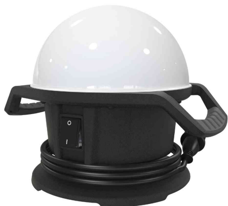
Projecteur de travail LED Ball-Light