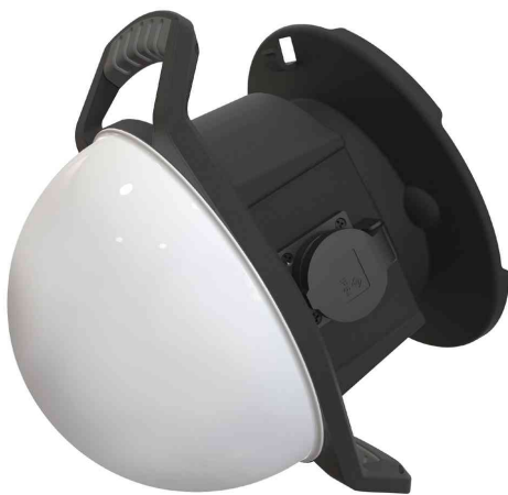
Projecteur de travail LED Ball-Light