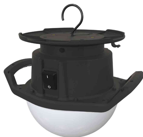
Projecteur de travail LED Ball-Light