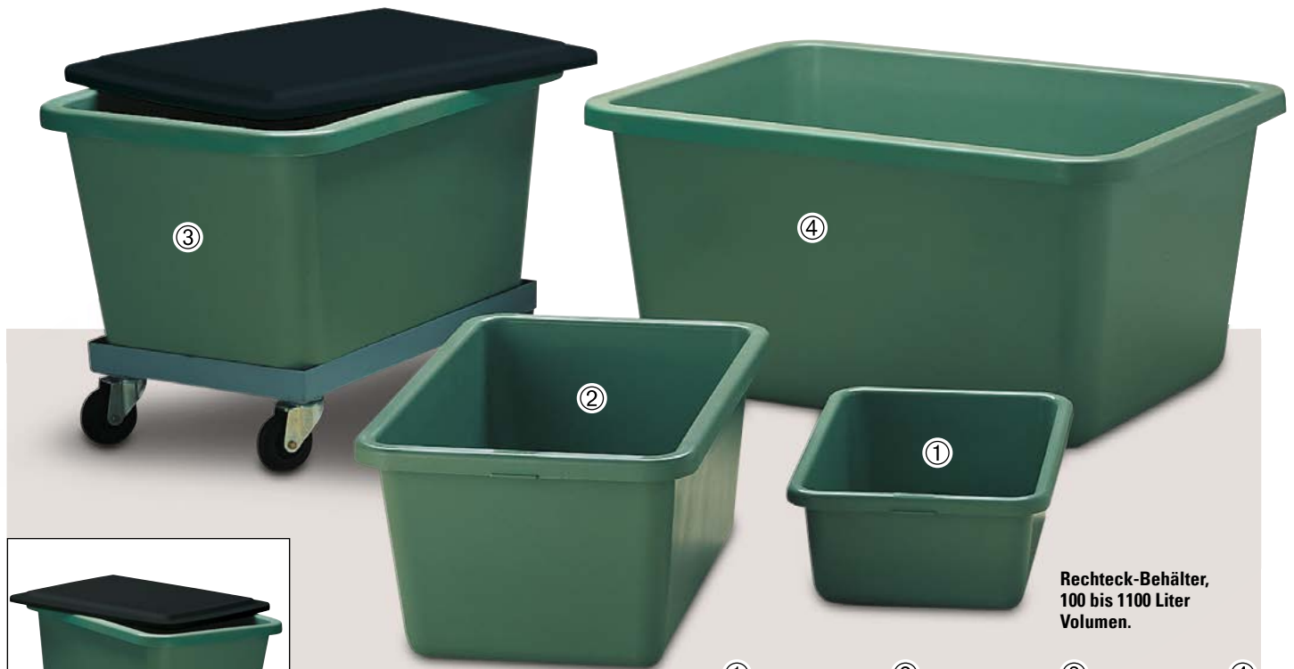
Rechteck-Behälter, 100 bis 1100 Liter Volumen.