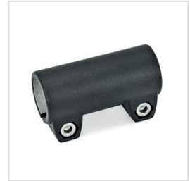
3 Kennziffer 2 mit 2 Edelstahl-Zylinderschrauben DIN 912