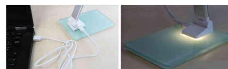
Visuel de référence: Alimentation électrique / veilleuse intégrée