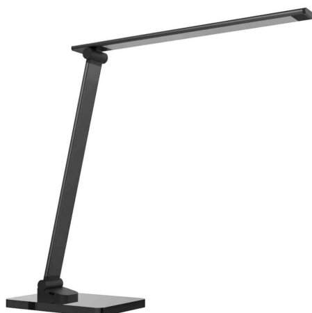
Lampe de bureau à LED POPY, noir