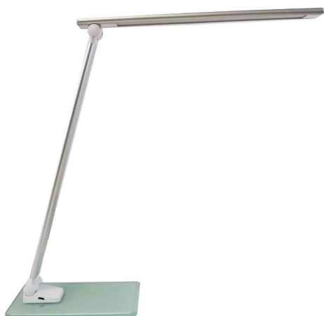
Lampe de bureau à LED POPY, argent

- pour travailler, lire ou se détendre, une lampe sur mesure !