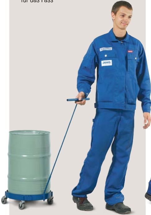
Fassroller DT 1 / 60, aus Stahl, für 60-Liter-Fässer, inkl. Zugstange.