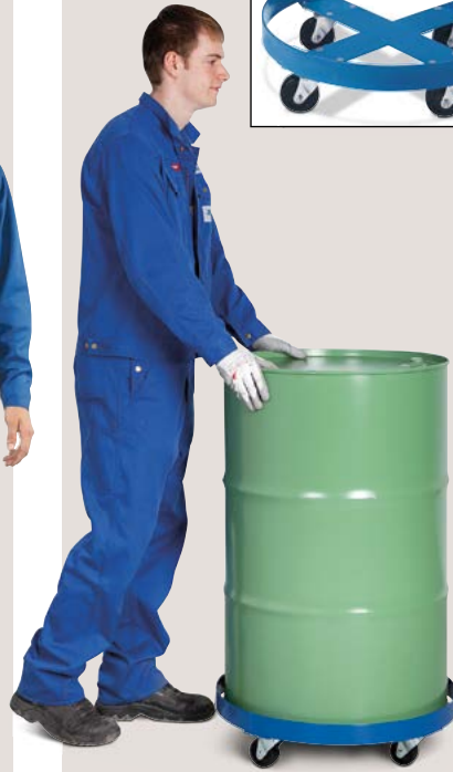
Fassroller DT 1 / 200, aus Stahl, für 200/220-Liter-Fässer.