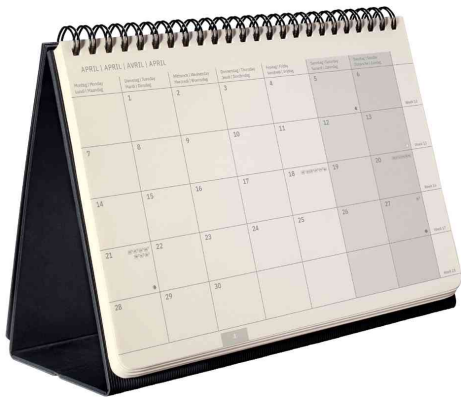
Calendrier de table Conceptum, mis en place